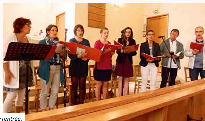
Culte de rentrée.