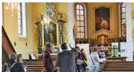
Porte ouverte à l'église- Rallye de découverte.

Le samedi 26 septembre, une célébration œcuménique a bien rempli l'espace de l'église de Rountzenheim, autour du thème : « Suis-je le gardien de ma terre ? ». Une dynamique équipe interconfessionnelle a préparé cela, avec une belle équipe musicale, l'exposition « Église verte », et deux