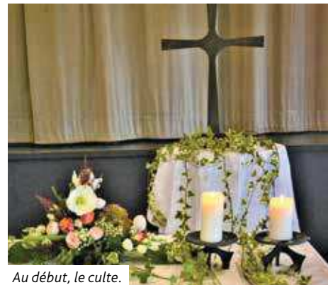
Au début, le culte.

La paroisse de Rountzenheim-Auenheim-Soufflenheim a choisi de reprendre l'organisation de la Fête paroissiale ce 16 octobre, dans la salle Vauban, avec possibilité de repas à emporter, et culte déjà sur place.