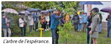
L'arbre de l'espérance.