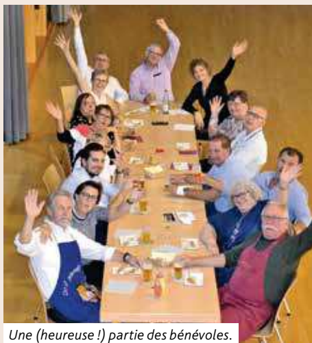
Une (heureuse !) partie des bénévoles.

Ce retour de la fête a été une réussite ! Malgré le nombre de convives moins important, tous les présents ont été heureux de se retrouver, de retrouver l'ambiance conviviale et musicale ainsi que les couples de danseurs, de retrouver la tombola, les gâteaux. L'équipe des bénévoles, un peu recomposée, a été heureuse de se retrouver, comme en témoigne la photo. C'est un encouragement pour tous.