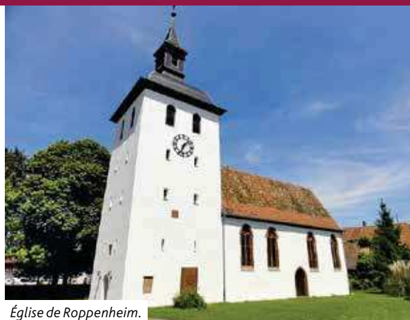
Église de Roppenheim.

Faire revivre la fête, après les années Covid, pour permettre la rencontre et renouer des liens, voilà l'objectif et le pari de cette fête annoncée. Une feuille d'invitation avec toutes les informations sera distribuée en temps utile dans les foyers. Réservez-vous la date !