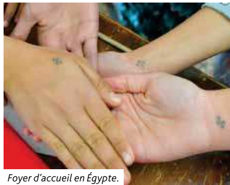
Foyer d'accueil en Égypte.

Un grand merci à Joséphine pour son intervention !