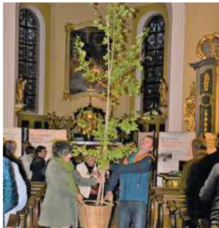
Célébration œcuménique : suis-je le gardien de ma terre ?