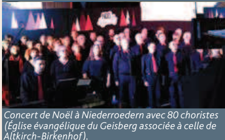
Concert de Noël à Niederroedern avec 80 choristes (Église évangélique du Geisberg associée à celle de Altkirch-Birkenhof).