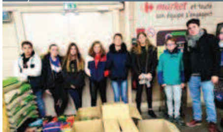
Les confirmands participent à la collecte de la Banque Alimentaire.