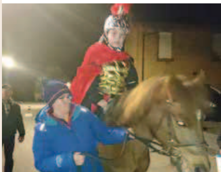
Saint Martin à Croettwiller.