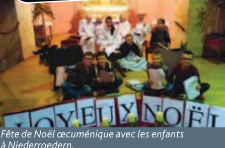
Fête de Noël œcuménique avec les enfants à Niederroedern.