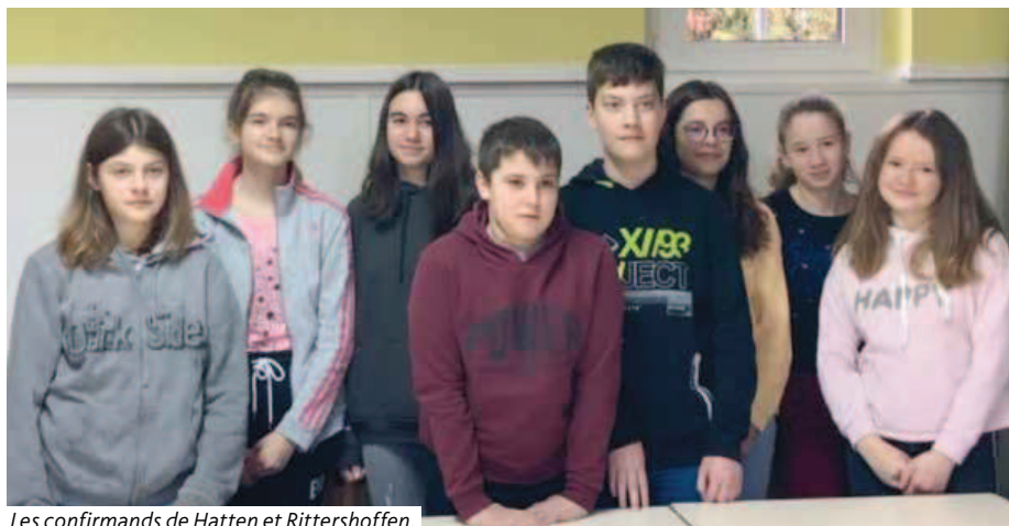
Les confirmands de Hatten et Rittershoffen.